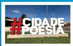
Praça da Poesia

Venha conhecer nossas belezas naturais, nossa riqueza cultural e a famosa gastronomia da “Capital da Linguíça Artesanal”.