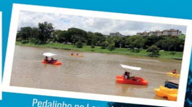
Pedalinho no Lago do Taboão