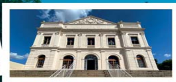
Centro Cultural “Teatro Carlos Gomes”