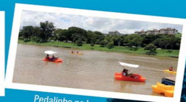
Pedalinho no Lago do Taboão