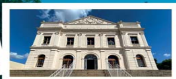
Centro Cultural “Teatro Carlos Gomes”