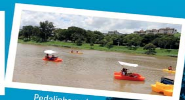
Pedalinho no Lago do Taboão