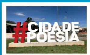
Praça da Poesia

Venha conhecer nossas belezas naturais, nossa riqueza cultural e a famosa gastronomia da “Capital da Linguíça Artesanal”.