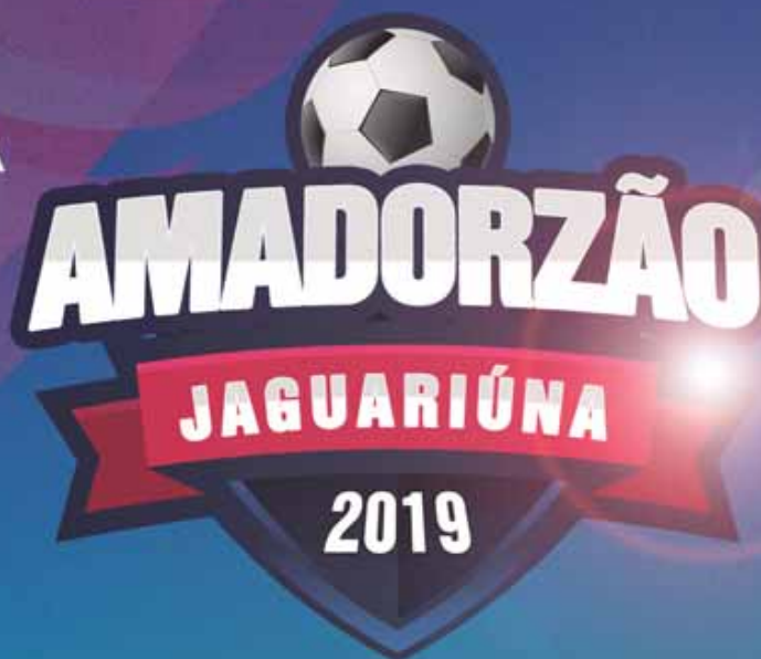
TABELA DE JOGOS

28 TIMES DISPUTAM AS TAÇAS DE OURO E PRATA