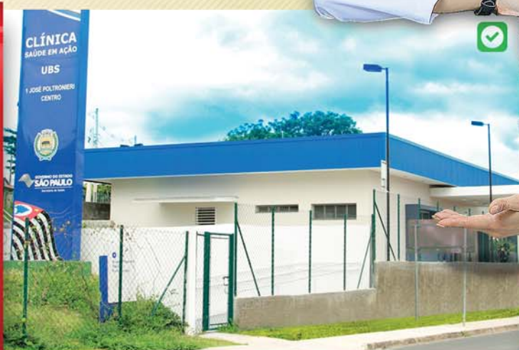
UBS NOVA JAGUARIÚNA