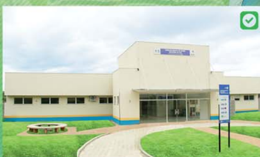
UBS CRUZEIRO DO SUL