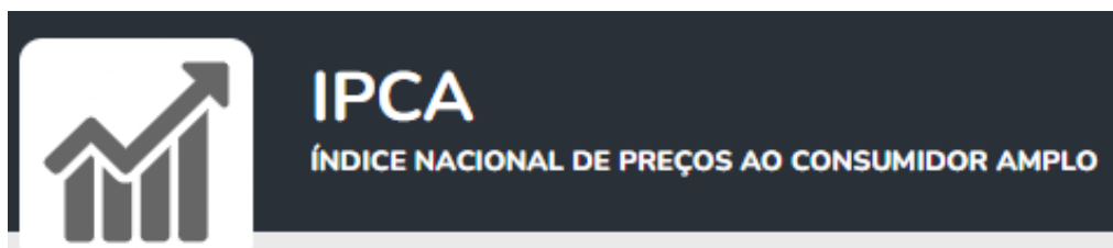
Tabela IPCA 2026