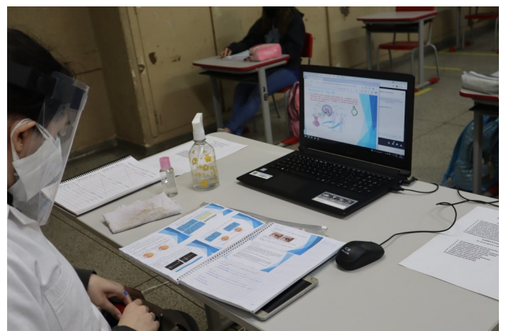
Professora da Escola Athayr da Silva Rosa de Urupês no primeiro dia de aula simultâneas

As aulas presenciais acontecem de forma híbrida, e os alunos fazem rodízios semanais. Todas as instituições estão sendo devidamente higienizadas, e os alunos que voltaram às salas de aula estão equipados com máscara facial. As escolas disponibilizam também álcool em gel à todos que frequentam as instituições municipais.