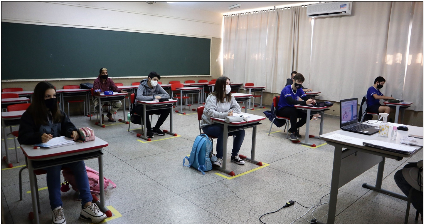
Alunos da Escola Athayr da Silva Rosa de Urupês no primeiro dia de volta às aulas 11/08/2021

A Secretaria de Educação reabriu as escolas municipais de Urupês, na última quarta-feira (11/08), para o retorno gradual das aulas. Os alunos foram divididos em turmas para as aulas presenciais, e parte dos estudantes permanecerão assistindo as aulas remotas.