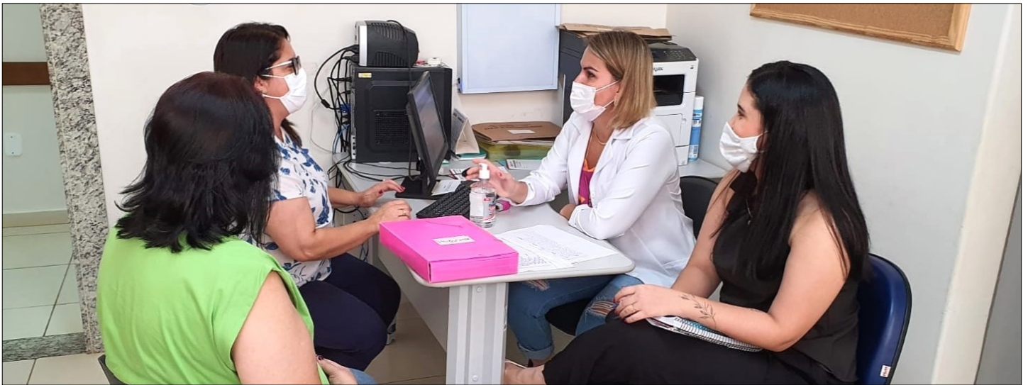
Gestora e equipe de profissionais reúnem-se para orientações finais para início dos atendimentos.

Começam, nesta segunda-feira (14), os atendimentos no Ambulatório Multiprofissional Especializado em Saúde Mental (Ament), serviço oferecido pela Secretaria Municipal de Saúde de Urupês que vai prestar atendimento a pessoas com transtornos mentais prevalentes e de gravidade moderada, como transtornos de humor, de ansiedade e dependência química.