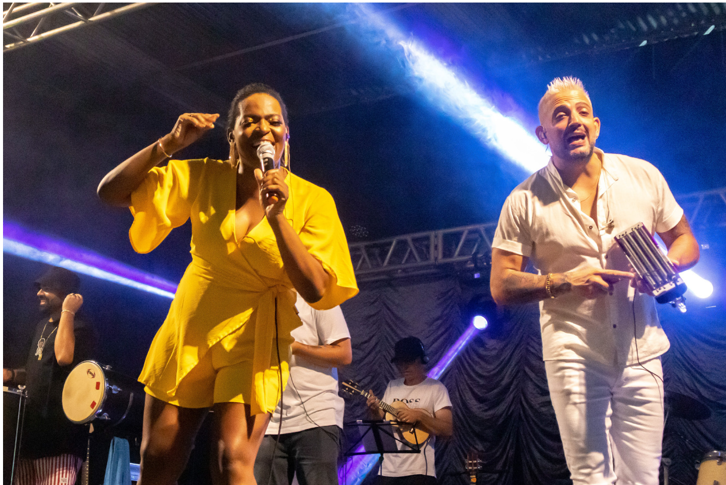
Banda Nossa Vibe animou virada do ano na praça.

A chegada do novo ano foi comemorada com muita dança e animação em Urupês. Uma multidão de centenas de pessoas passou pela praça central, para curtir a chegada do novo ano, junto a familiares e amigos.